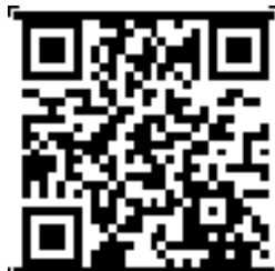
左手香故事館 FB 網址